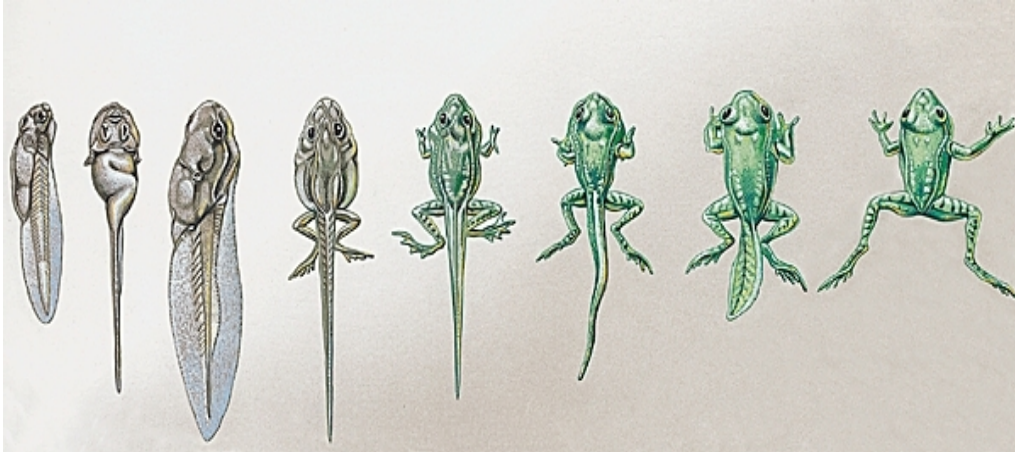
Métamorphose de la grenouille